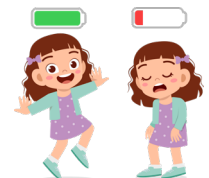
Over grenzen gaan met vermoeidheid als gevolg