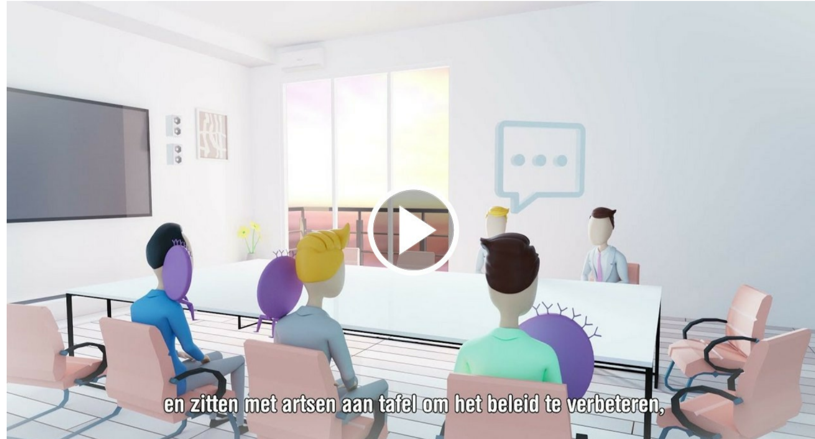
en zitten met artsen aan tafel om het beleid te verbeteren.